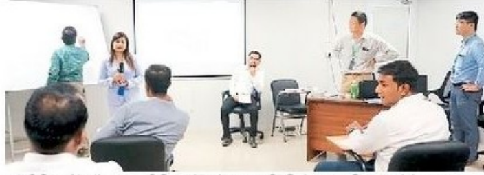
इंजीनियरों और तकनीशियनों को जापानी विशेषज्ञ प्रशिक्षण देते हुए।

सूरत. मुंबई-अहमदाबाद एचएसआर कॉरिडोर (एमएचएसआर) के टी-2 पैकेज, जिसमें वापी और वडोदरा के बीच 237 किमी की दूरी शामिल है। इसके लिए भारतीय इंजीनियरों और वर्क लीडर्स के लिए हाई-स्पीड रेल ट्रेक सिस्टम का प्रशिक्षण शुरू किया गया है।