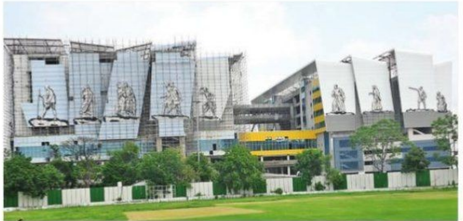
Training for laying track along the 'T-2 package' that covers the 237-km Vapi-Vadodara stretch has begun

The training will have 15 different courses covering all aspects of